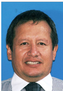
di Carlos Barberi