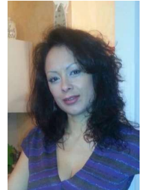
traduzione di Johanna Carolina Gambassi

...la sua grande evoluzione risiede nel fatto che i suddetti metodi terapeutici sono più indicati per IL BAMBINO DI OGGI CHE NON E' PIÙ DISPOSTO AD USARE VOLUMINOSI APPARECCHI BIMASCELLARI.